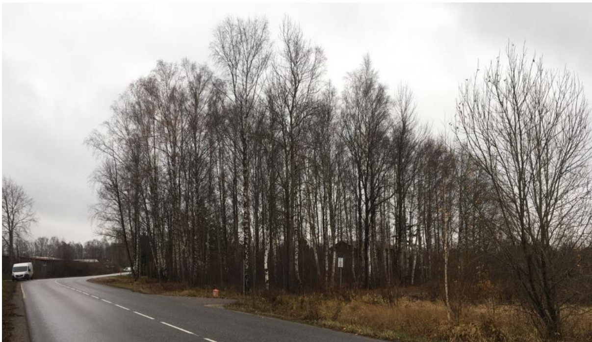
Joonis 2 Vaade Pähkli tn 13 kinnistule

Arvestades, et Savi tänav on peamiselt Niidu tööstuspiirkonda teenindav veotänav, kus liiguvad ka raskeveokid, siis ei ole ala otstarbekas üksikelamu planeerimiseks. Mõistlik on Savi tänava äärde näha ette mõni muu juhtotstarvet toetava funktsiooniga hoone tingimusel, et hoone funktsioon ja tehnoseadmed ei avalda ülemäärast kahjulikku mõju lähedal olevatele elamutele.